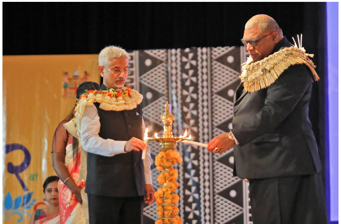
His Excellency The President Ratu Wiliame Katonivere with the Minister for External Affairs of India, Dr Subramaniam Jaishankar at the opening of the 12th World Hindi Conference in Nadi.

The opening of the conference was followed by the release of a postal stamp and the launch of six books by Dr Jaishankar and President Katonivere.