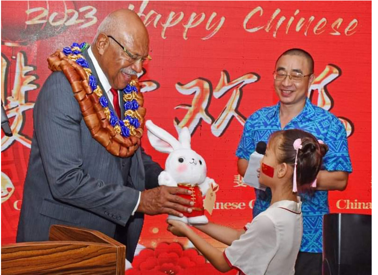
प्रधान मंत्री सितिवेनी रम्बुका, चीन के नए साल के मौके पर एक छात्र को उपहार भेंट करते हुए

करने की कोशिश करते हैं। “हमारी दोस्ती अच्छे और बुरे समय के लिए जानी जाती है। जब दूसरे देश मुकर जाते हैं, चीन रुकने का चुनाव करता है।” चीन अन्य क्षेत्रों में और सहयोग देने के लिए तैयार है जैसे कि कृषि, मछली के व्यवसाय, गरीबी कम करने, मौसम में हो रहे बदलाव तथा प्राकृतिक विपत्ति से बचाव शामिल है। अपने नज़दीकी सहयोग के माध्यम से हम फीजी के लोगों के लिए अधिक ठोस लाभ लाने का प्रयास करेंगे।