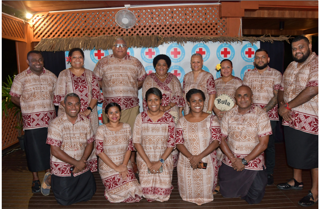
President Ratu Wiliame Katonivere with First Lady Filomena Katonivere and staff of Fiji Red Cross at the event.

“In the last 50 years, the Red Cross has been synonymous with hope, humanitarian relief, support and assistance to the disadvantaged and vulnerable,” he added.