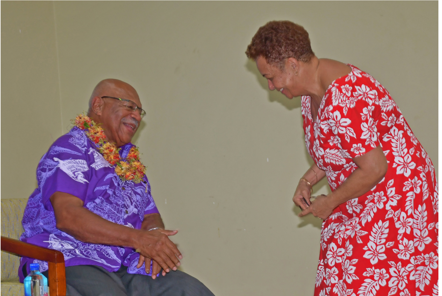
Prime Minister Sitiveni Rabuka received a courtesy call from the Vanua o Bau at the GCC Complex in Nasese.