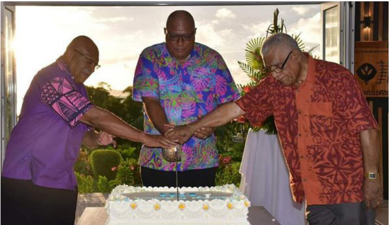
Na soqo ni oti na nodra dolava na Palimedi na Turaga Peresitidi.

“Me rawa ni veitosoyaki kina na ilavo oqo. Me rawa ni caka kina na sausaumi ena ilavo sa biu rawa tu me baleta na yabaki oqo ka na qai lai oti tiko yani ena yabaki vakailavo ena veimama ni yabaki na Budget ka vakadonui mai ena veimama ni yabaki sa oti.”