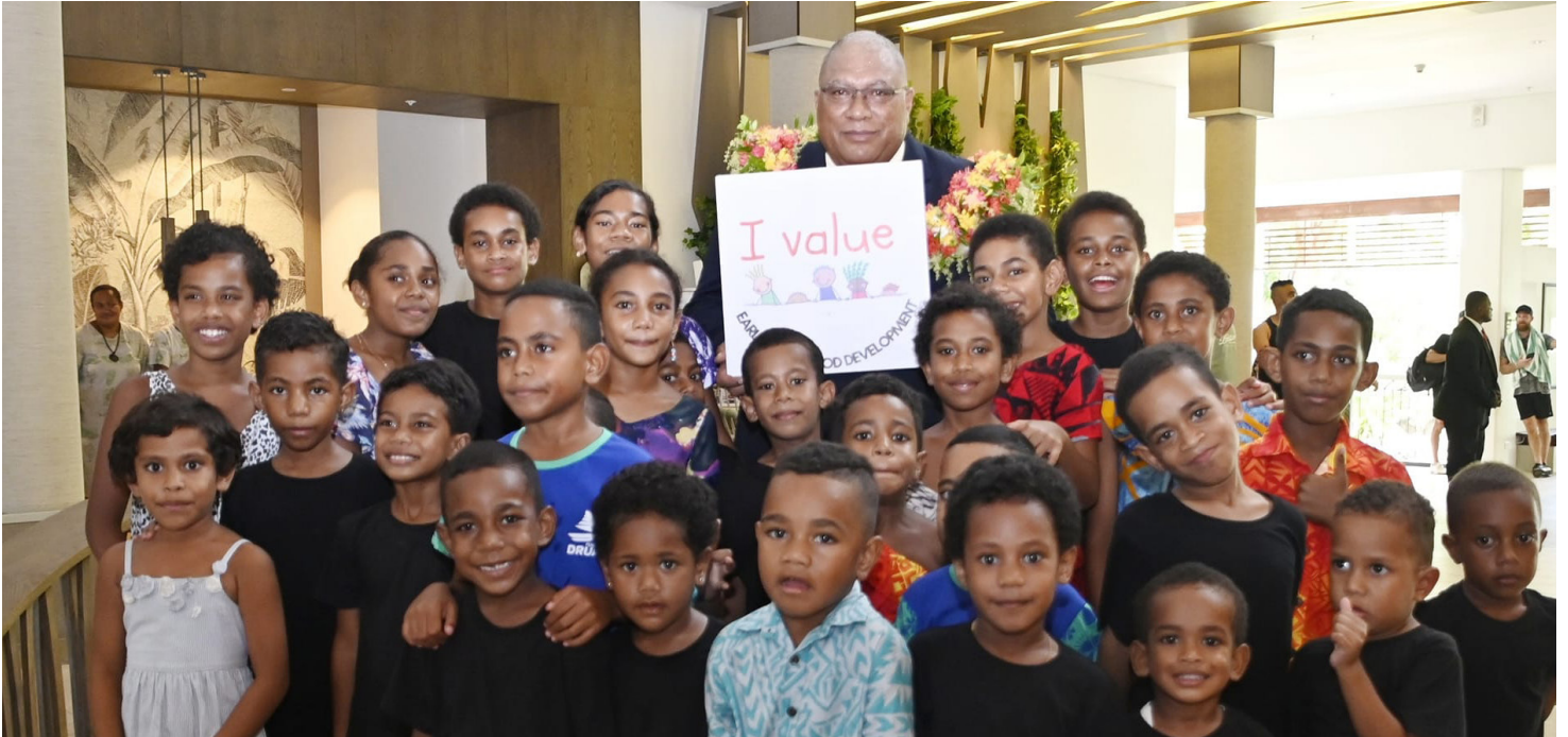
The President Ratu Wiliame Katonivere with children at Early Childhood Development.