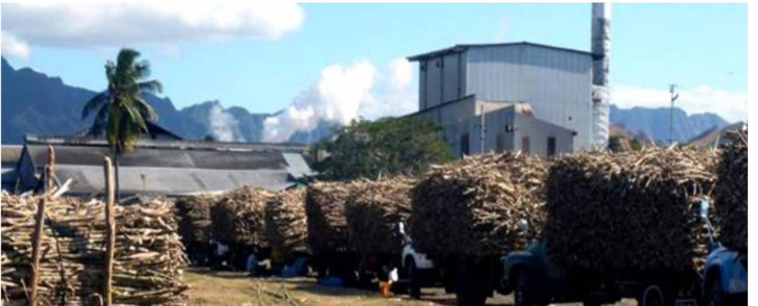
पिनेन्ना चीनी मिल का संचालन सुधारने के लिए सरकार ने कई मिलियन डोलर लेकिन खास सुधार नहीं हुआ

उन्होंने कहा कि वो राकीराकी में एक मिल न केवल किसानों के फायदे के लिए बनाना चाहते हैं बल्कि इससे खर्च भी घटाया जाएगा। चीनी मंत्री के अनुसार यह उनकी सामाजिक ज़िम्मेदारी भी है कि वे देखें कि राकीराकी में यह योजना पुनःजिवित हो क्योंकि बहुत से लोग अभी भी इस व्यवसाय पर निर्भर हैं।