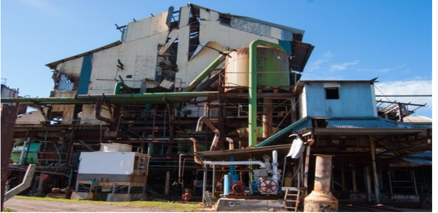
राकीराकी चीनी मिल की बिगड़ती हालत के कारण मिल का संचालन बन्द कर दिया गया है