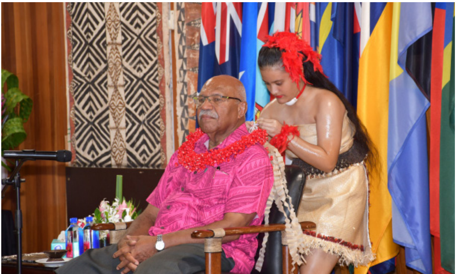
Pacific Islands Forum (PIF) chairman, Fiji’s Prime Minister Sitiveni Rabuka, while being welcomed at the PIF Secretariat in Suva.

“I am looking forward to contributing to developing the Forum. I promise, that the Government I lead while I am chair and even after I’m chair will be committed to our collective goals, collective mission and our one vision for a great, united Pacific region,” PM Rabuka stated.