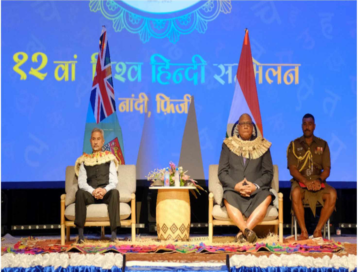
देनाराउ नान्दी स्थित शेराटन होटल में विश्व हिन्दी सम्मेलन के उद्घाटन समारोह में राष्ट्रपति रातु विलियामे कातोनिवरे तथा भारत के विदेश मंत्री श्री सुब्रामनियम जयशंकर

रही है। पहला विश्व हिन्दी सम्मेलन 1975 में नागपुर भारत में हुआ था जिसका उद्घाटन उस वक्त की प्रधान मंत्री स्वर्गीय इंद्रा गाँधी ने किया था। यह सम्मेलन अब हर तीन सालों में होता है तथा जिन देशों ने इस सम्मेलन की मेज़बानी कर ली है में अमरिका, युनाएटड किंगडम, मौरिशस, ट्रिनिडाड और तोबागो तथा सुरिनाम शामिल है। यह सम्मेलन पंद्रह से सत्रह फरवरी तक देनाराउ नान्दी में हुआ।